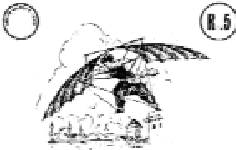
İbni Fernas (... 388)

lan şerefine hipodromda tantanalı şenlikler icra ettirmişti. Bizanslılar bu meydana bütün hünelerini gösterdiler. Bu esnada Kılıç Arslan'la beraber gelen bir Türk, Atmeydanı'ndaki Dikilitaş üzerinden uçağını bildirdi. Adam Dikilitaş üzerine çıktı. Sırtında gayet uzun, geniş ve beyaz bir elbise vardı. Bu beyaz elbise bir paraşüt gibi şişiyordu.